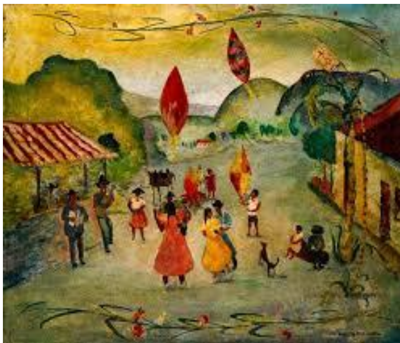
Obra de Anita Malfatti

1. Observe a imagem e responda a seguinte questão.